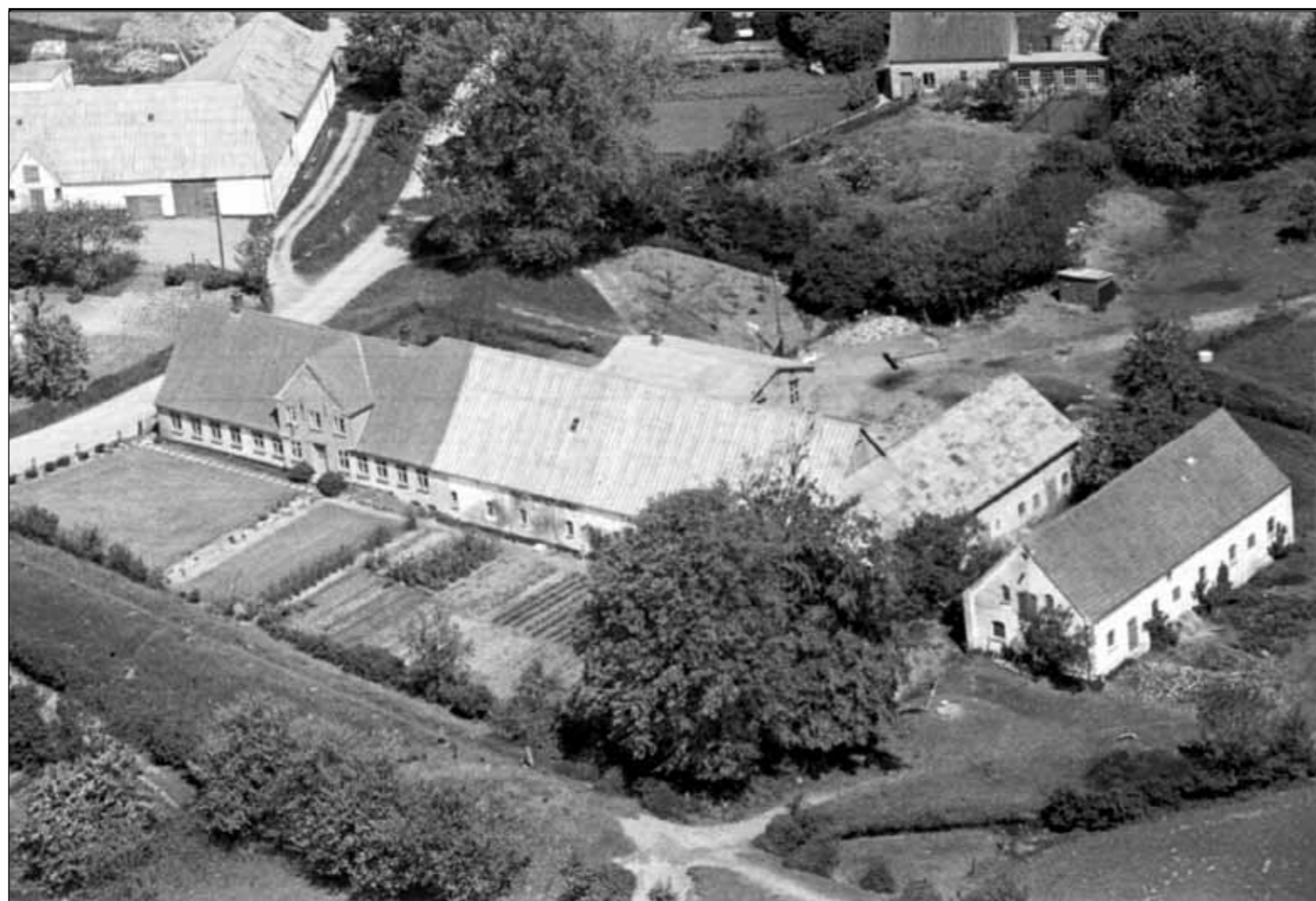
Junkergården (1948/1952 Det Kgl. Bibliotek)

Gården kan spores tilbage til 1688 og har gennem århundreder været hjem for familier, der med hårdt arbejde og engagement har præget Hundslev og landsbyerne Almsted og Notmark.