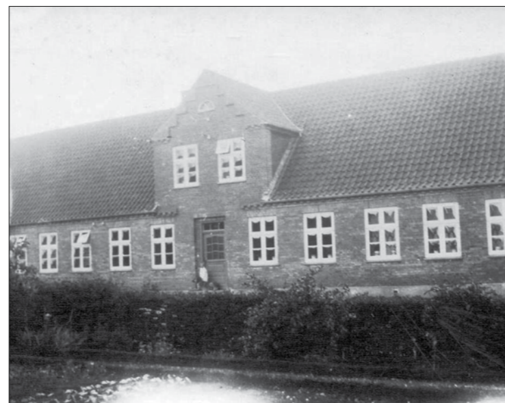
Søndergade 5 som det så ud 1915