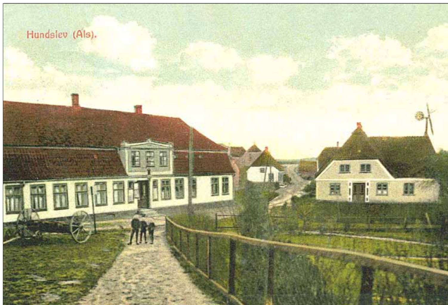
Hundslev kro 1920

Foruden krostuen blev der holdt private fester, ikke mindst den årlige brandværnsfest med præmieskydning, børneforlystelser og andet. Dengang en is kostede 10 øre. Festen sluttede med bal hvor store og lille Søren sørgede for musikken.