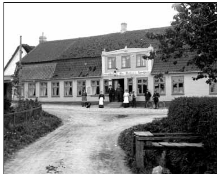
Hundslev kro ca. 1910