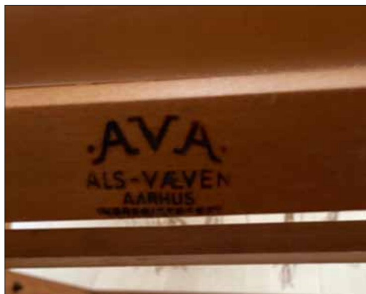
Navnet på væven samt forhandler

Produktionen fik lidt af en renæssance efter krigen, men det blev ikke det store.