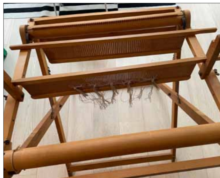
En af de mellemstore væve