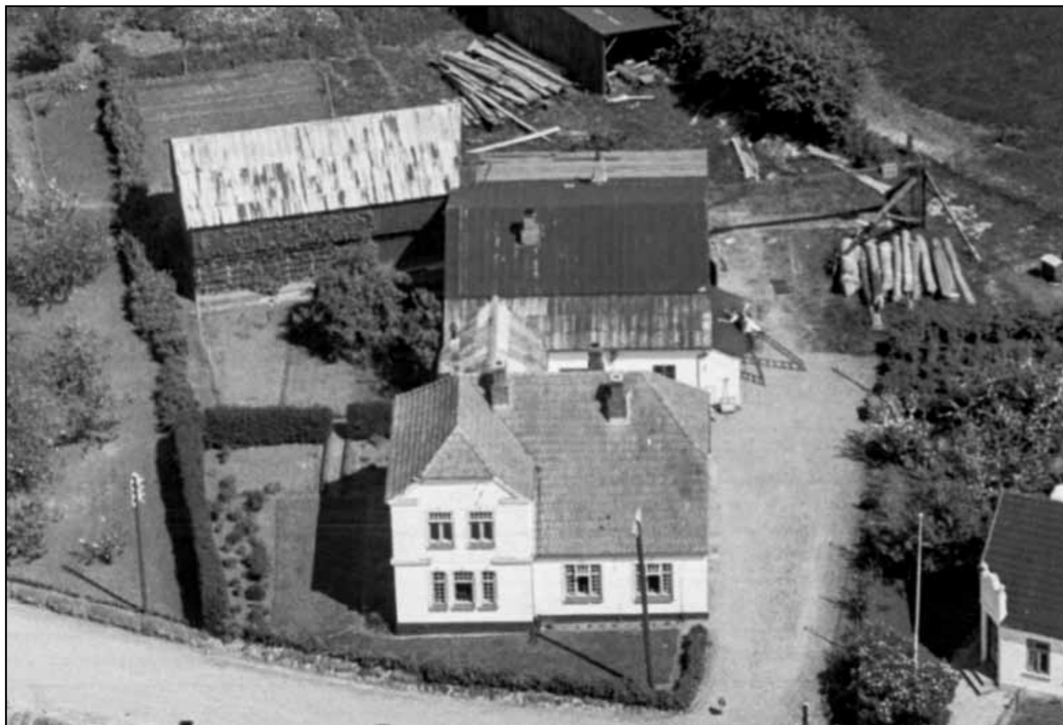
Lykkevej 17 hvor væven blev fremstillet (1952)