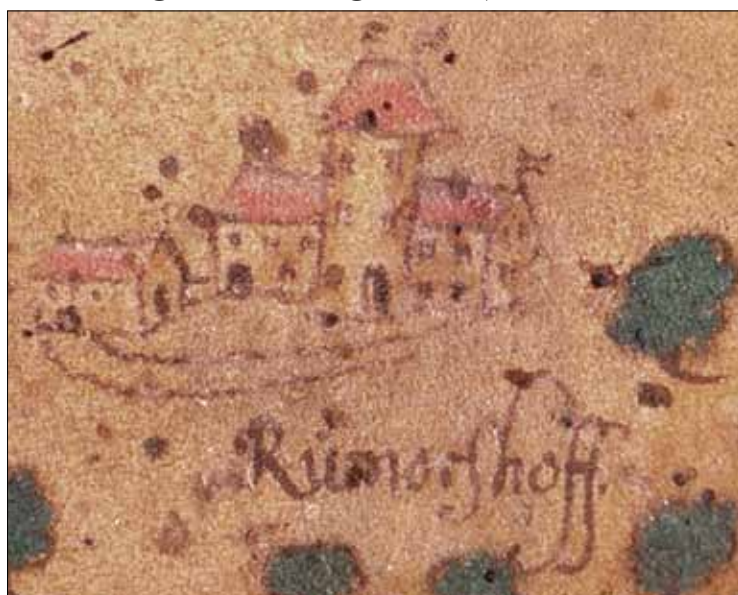
Tegning af Rumohrsgård 1655