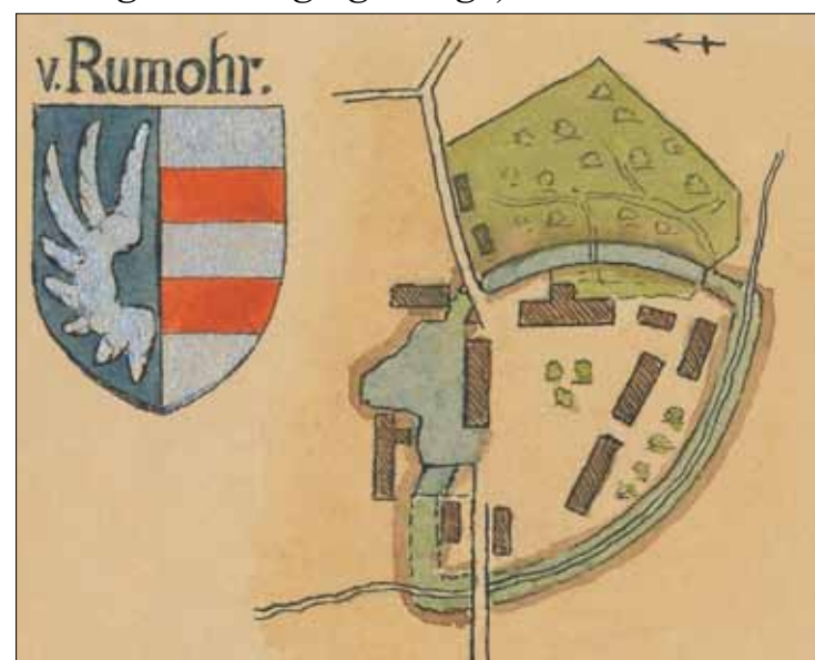
Våbenskjold og plan for Rumohrsgård