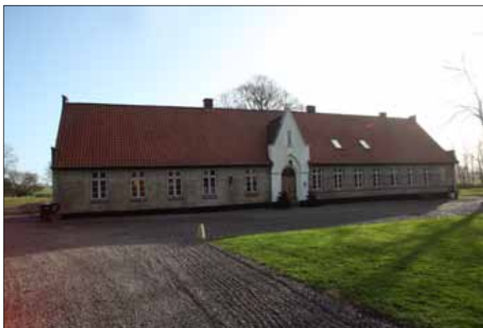
Rumohrsgård 2022 (Steen Weile)

Denne ejer skildres af hans arbejdsfolk, som en sjældnen human og retsindet arbejdsgiver, der ikke allene så på egen fordel, men som også havde sin glæde i at gavne og fornøje sine undersåtter, hvormed der endnu fortælles mange småtræk.