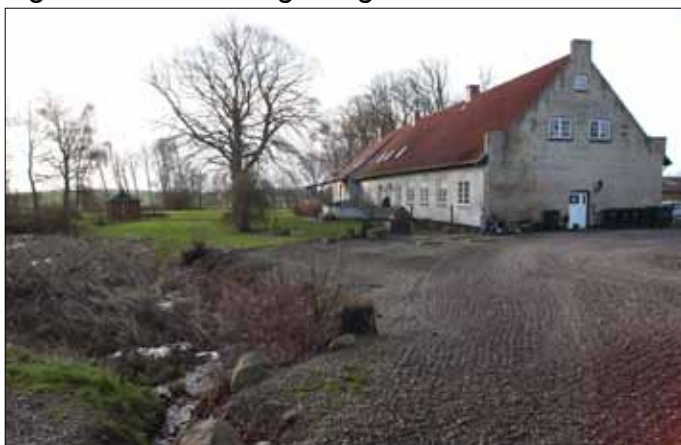
Rumohrsgård 2022 (Steen Weile)

Gårdens arbejdskraft, som jo dengang så godt som udelukkende hentede fra de omliggende landsbyer, fik særlig i høstens tid, foruden udmærket kost, betydelig større dagløn, end på de andre herregårde her omkring. Møller, som den gang ejede Gammelgård, lod da også en dag sende bud hertil og bad Hellemann holde sig til den sædvanlige dagløn.