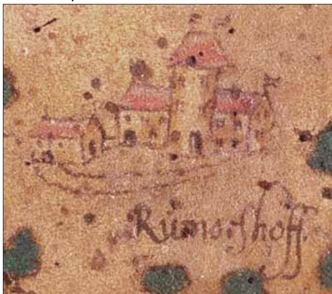
Tegning af Rumohrsgård 1655