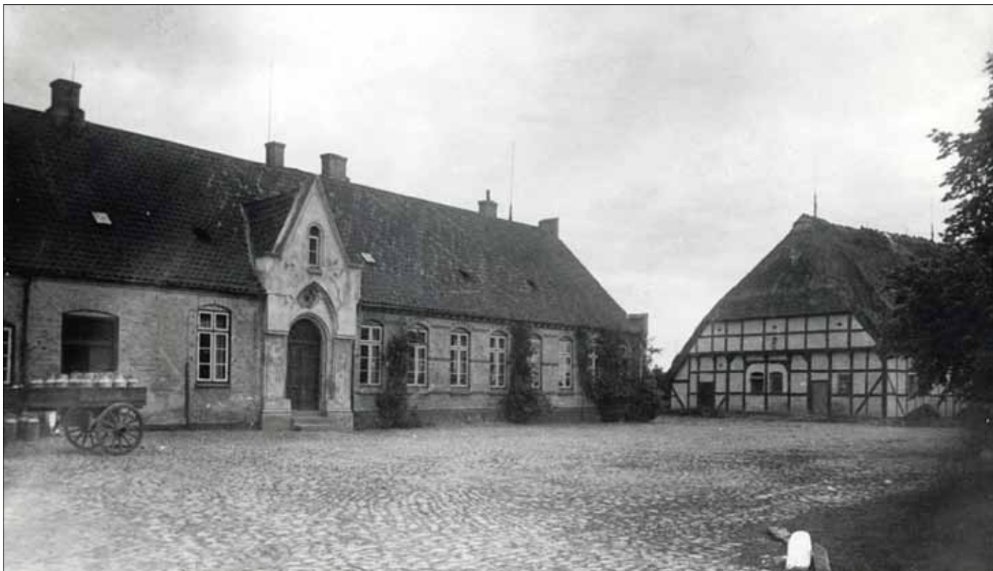
Rumohrsgård omkring 1920. (Lokalhistorisk arkiv Augustenborg og omegn).

Hertugen kaldte gården Rumohrsgård og udvidede den med nogle gårde i Hundsløv og med jordene til den nedlagte by Kolkaad i Ketting sogn. Denne by lå i det nuværende Stenbjergkobbøl, mellem fredskoven og dyrehaven og Ketting kappelani. Endnu i mands minde skal der være funden brolagte flader under muldjorden. Hertugen har også forbedret borgen som var i forfald da han overtog den, og benyttede dertil stenene fra det nedlagte gods Snogbæk-lund i Sundeved.