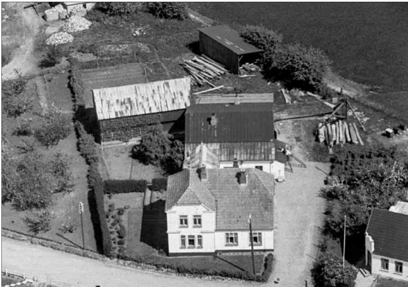
Lykkevej 17 Hundslev ca. 1950

Efter stor succes med produktion af vævene, flyttede vi i 1936 fra den lille by Asserballe Station til den lidt større by Hundslev. Min far fortsatte med fremstilling af væve i værkstedet i Asserballe Station, og udvidede produktionen i det større værksted i byen Hundslev med en ny produktions-række omfattende 6 - 8 nye typer. Jeg husker bedst de mindste nydelige røde børnevæve som var ca. 30 cm brede og 50 cm lange, og de største som var lakeret med klarlak på ca. 1,5 m til 2,0 m bredde, med ca. samme længde og højde. Han ændrede vel på dette tidspunkt navnet på sine væve fra "Væve - Jørgensen" til det mere korrekte "Als - Væven".