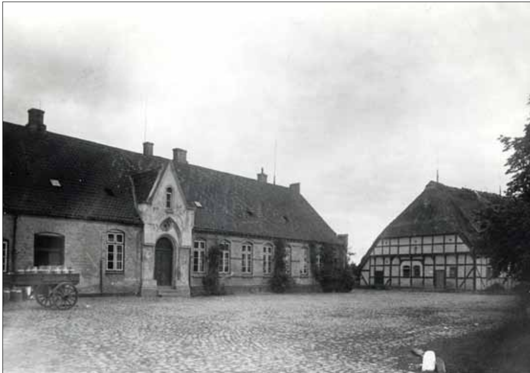
Lensgården Rumohrsgaard som den så ud før laden blev fjernet.