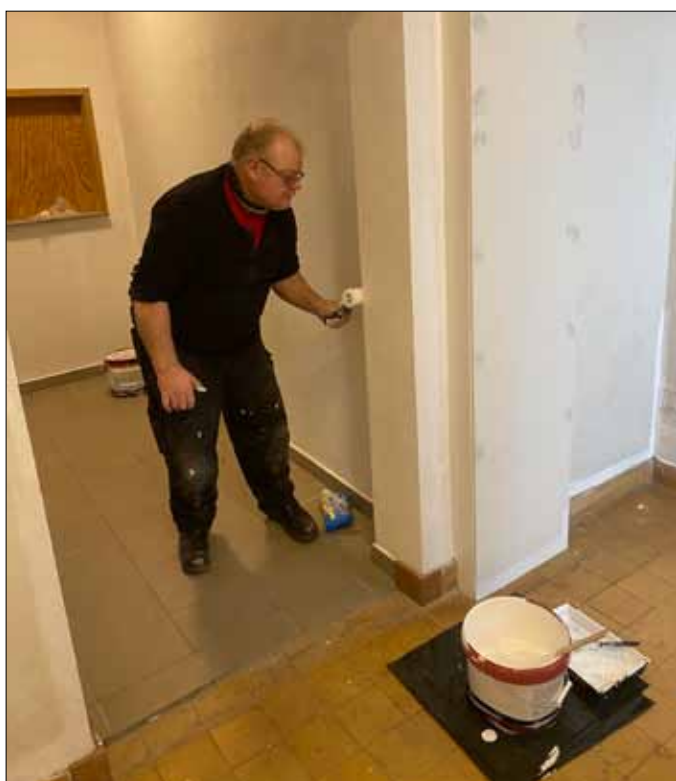
Kælderen bliver rigtig fin