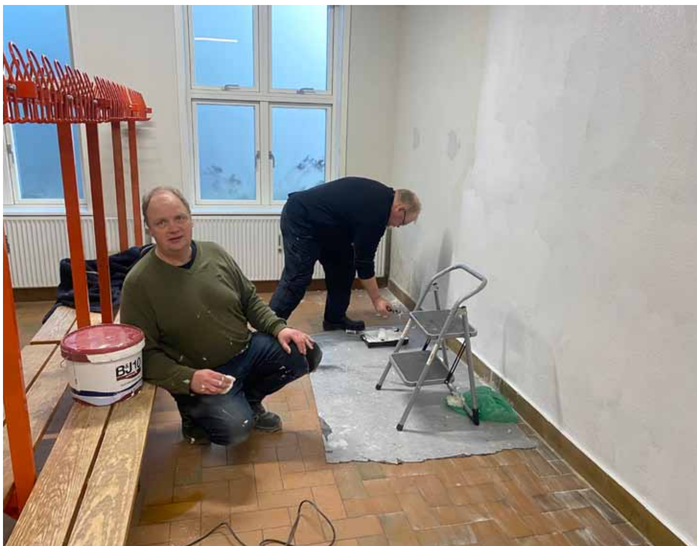
Fuld maleraktivitet i kælderen

Siden sidst havde 2 ihærdige beboere beklædt den dårlige væg på første sal med gipsplader. Den var blevet spartlet og første skridt var nu grundmaling. Vi mødtes 9 mand klokken 15.00 og gik igang både med maling i kælderen og i det store lokale på første sal. Det var en flok effektive hårdt arbejdende folk, så der skete virkelig meget. Det er et lidt anstrengende malerarbejde idet der er skråvægge og 12 ovenlysvinduer hvor man skal stå og ballancere på en taburet og lægge nakken godt tilbage. Men opgaver er til for at blive løst - så det gjorde vi. Efter 3½ times arbejde var der så spisning. En ildsjæl havde lavet flæskesteg med kartofler, brun sovs og rødkål - lækker. Vi var kommet rigtig langt, både i kælderen og rummet på første sal.