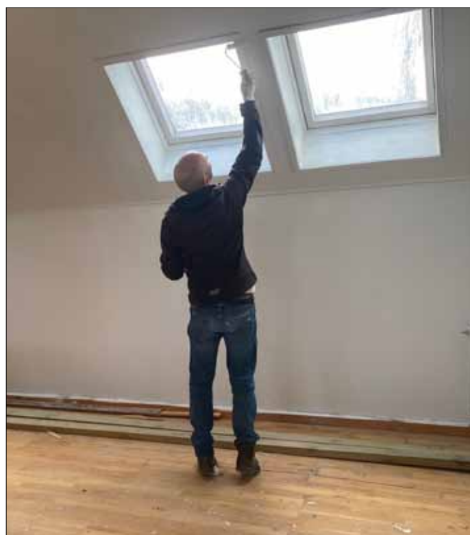
Man skulle have været lidt højere