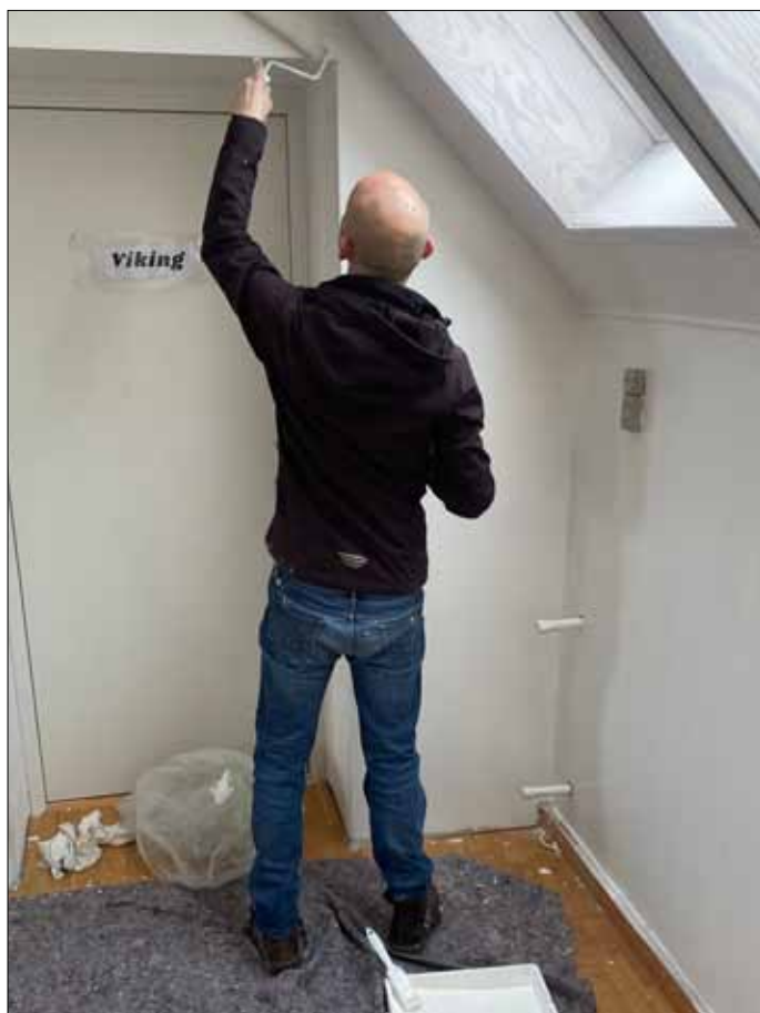
En "viking" der maler

Der skulle jo også laves noget så vi gik igang både i kælderen og ovenpå. Arbejdet skred godt fremad og det bliver rigtig fint. Vi blev ved indtil 12.30. Helt færdige blev vi ikke, men en aften eller to så skulle vi være færdige.