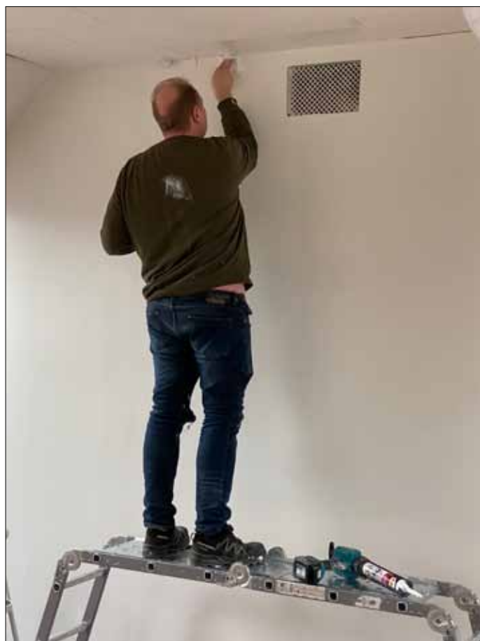
Så skal der fuges