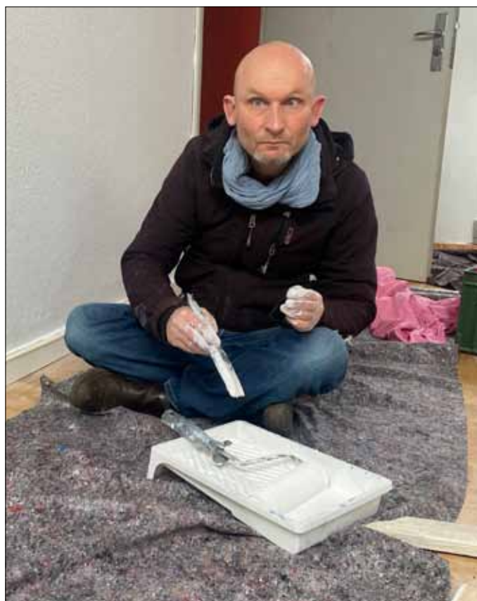
Fotografen generede en koncentreret maler