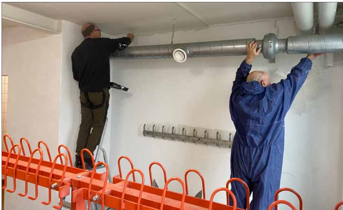
Så er der lige det sidste i omklædningsrummet i kælderen