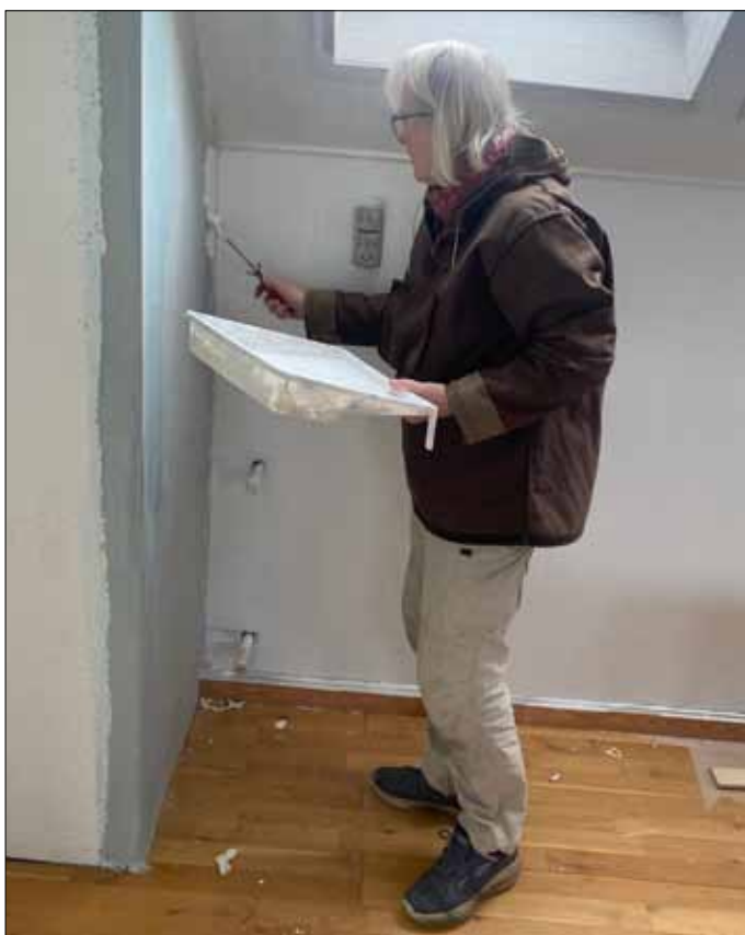
Fotografen generede en koncentreret maler