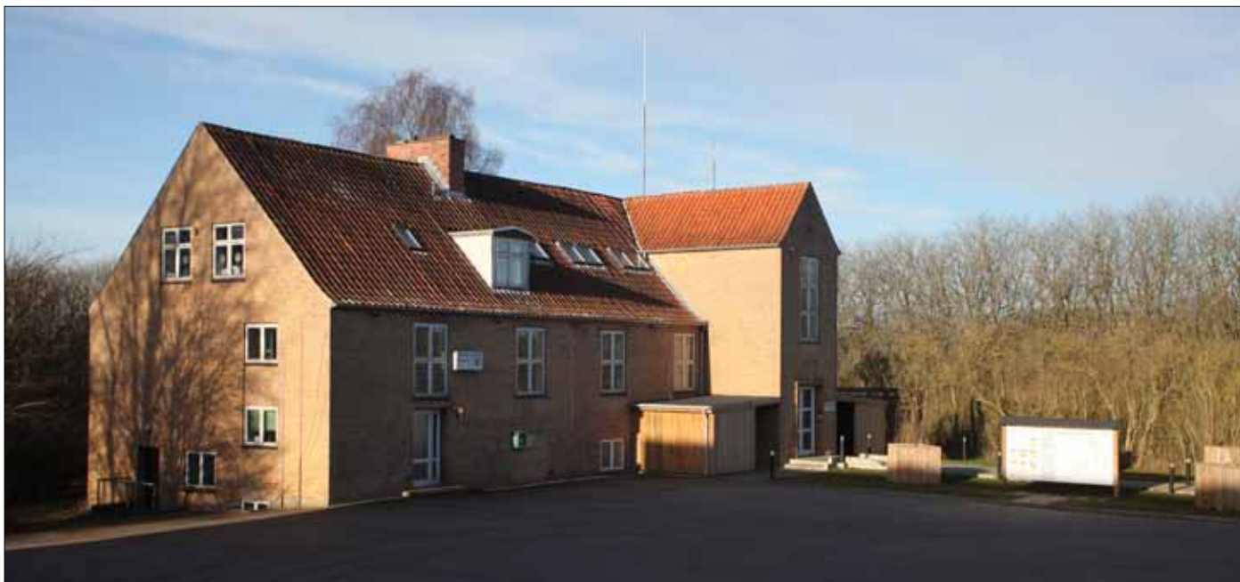
Indvendig vedligeholdelse klares af HAN Landsbylaug

Landbylauget HAN havde indkaldt til fortsættelse af arbejdet med indvendig maling med videre.