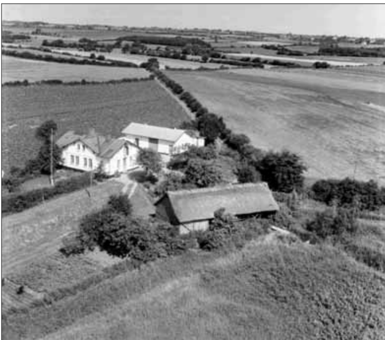
Luftfoto 1982 ( Danmark set fra luften ) Stedet hvor gården og møllen lå.