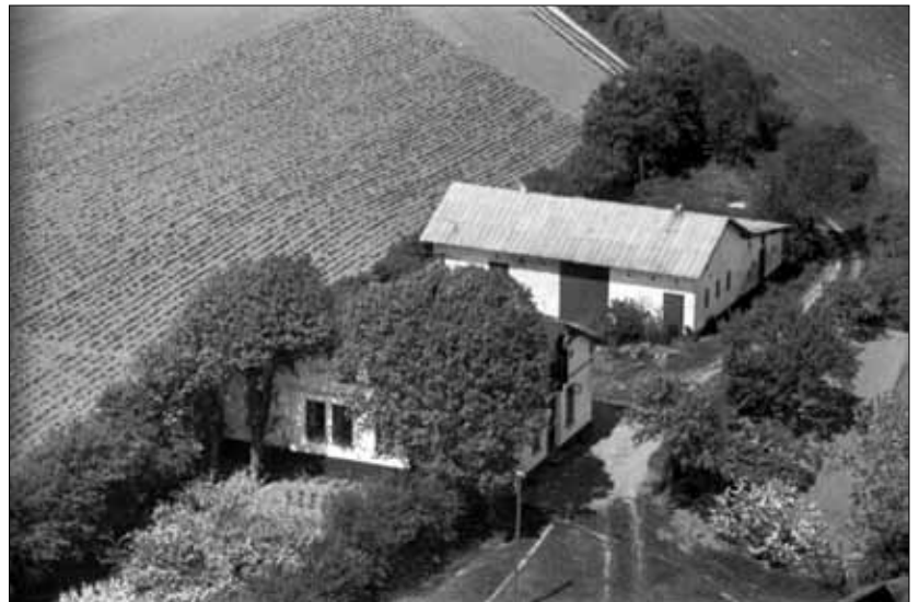
Gården 1962 ( Danmark set fra luften )