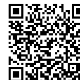
Stelen / søjlen

fremstillet og doneret af Petersen Tegl. Mindesmærket blev indviet i 1993. I 2001 besøgte hendes majestæt dronning Margrethe stedet og i 2017 blev søjlen renoveret af Steen Iwang.