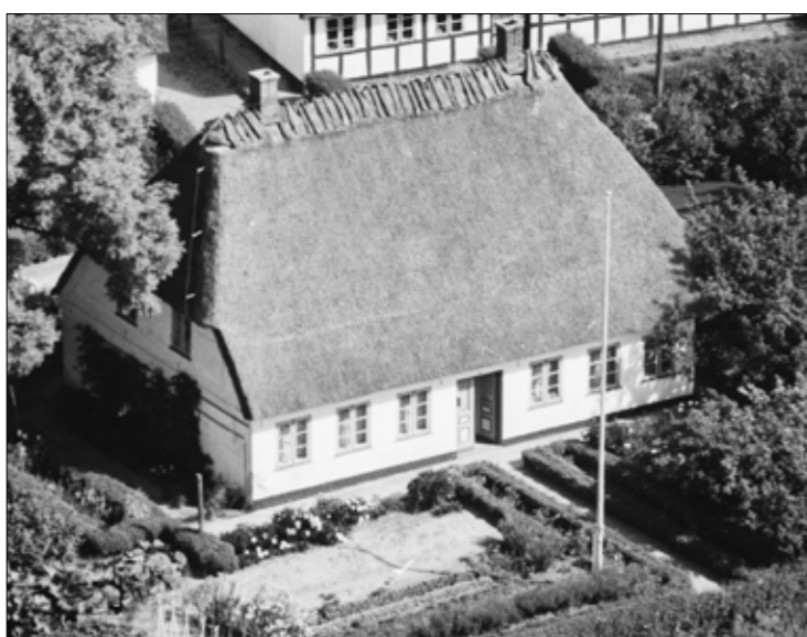
Sejmosvej 2, Hundslev "e Kaploni"